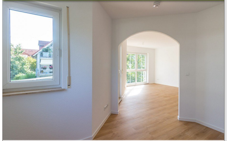
Schlafbereich-2-Raum-Wohnung-im-1-Obergeschoss-am-Krähenfeld-8 - Kopie