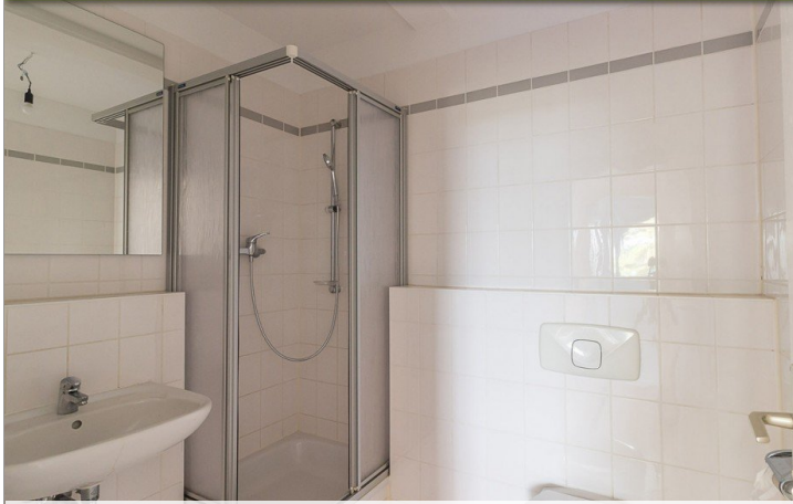
Badmit-Dusche-2-Raum-Wohnung-im-1-Obergeschoss-am-Krähenfeld-8 - Kopie