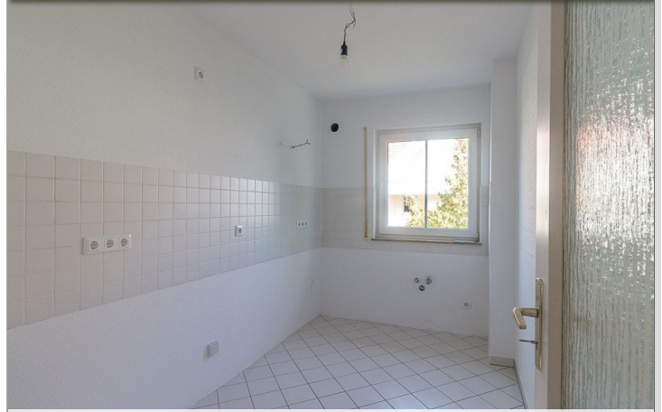
Küche-2-Raum-Wohnung-im-1-Obergeschoss-am-Krähenfeld-8 - Kopie