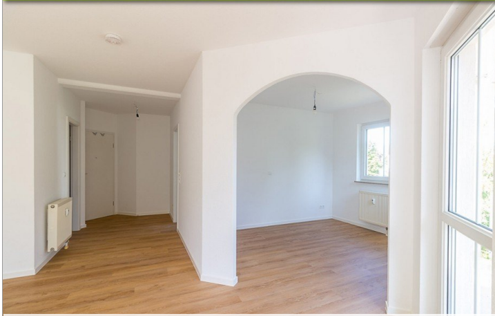
Schlafbereich-2-Raum-Wohnung-im-1-Obergeschoss-am-Krähenfeld-8 - Kopie