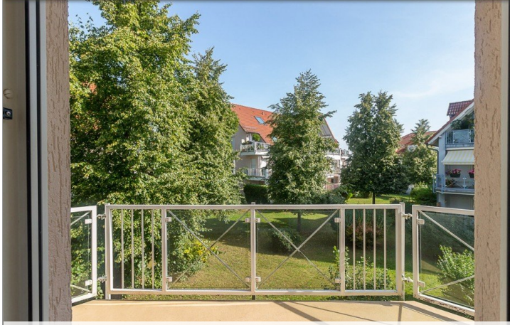
Blick-Balkon-2-Raum-Wohnung-im-1-Obergeschoss-am-Krähenfeld-8 - Kopie