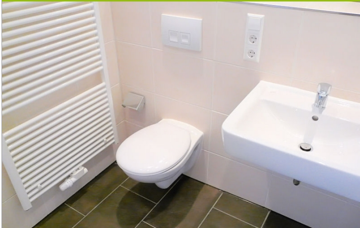
Bad (1) Beispiel