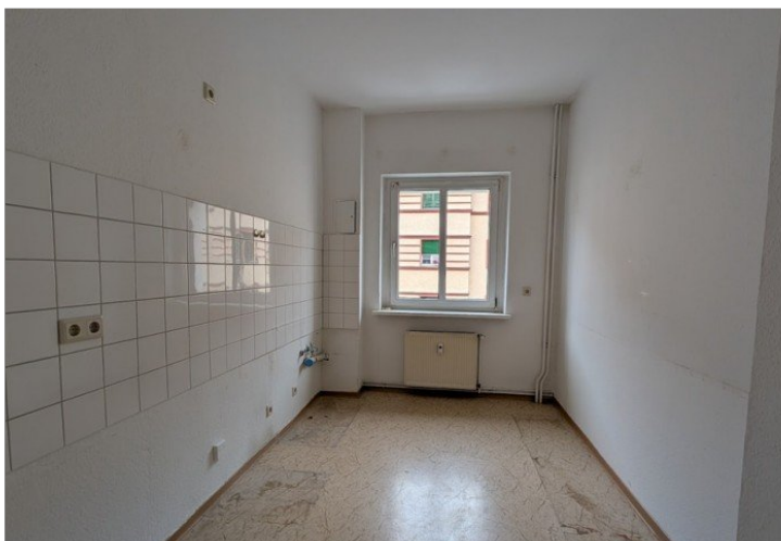
Küche unrenoviert - neuer Boden kommt