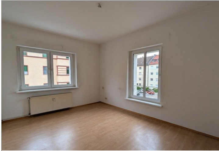
Wohnzimmer - wird noch gemalert