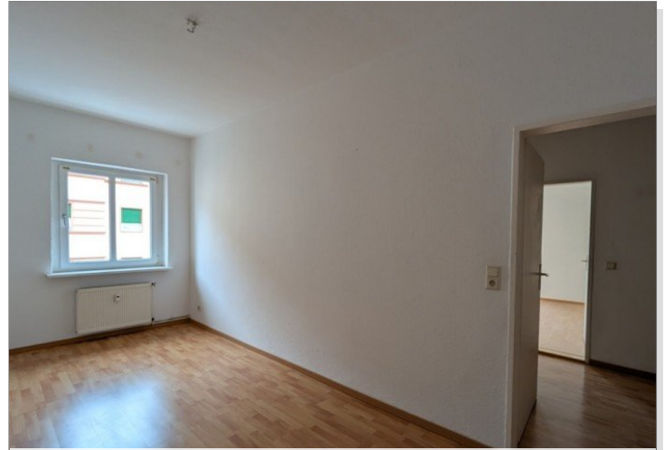
Schlafzimmer - wird noch gemalert