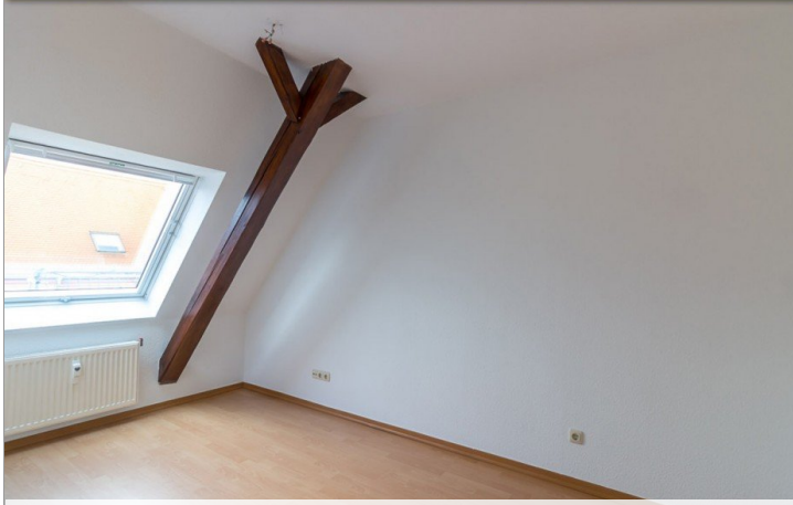
Schlafzimmer Beispiel Referenzwohnung