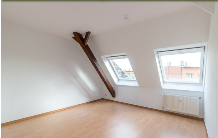
Wohnzimmer Beispiel Referenzwohnung