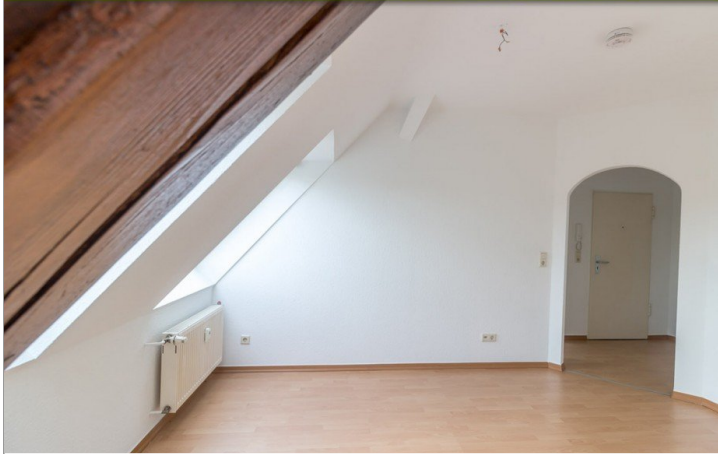
Wohnzimmer Beispiel Referenzwohnung