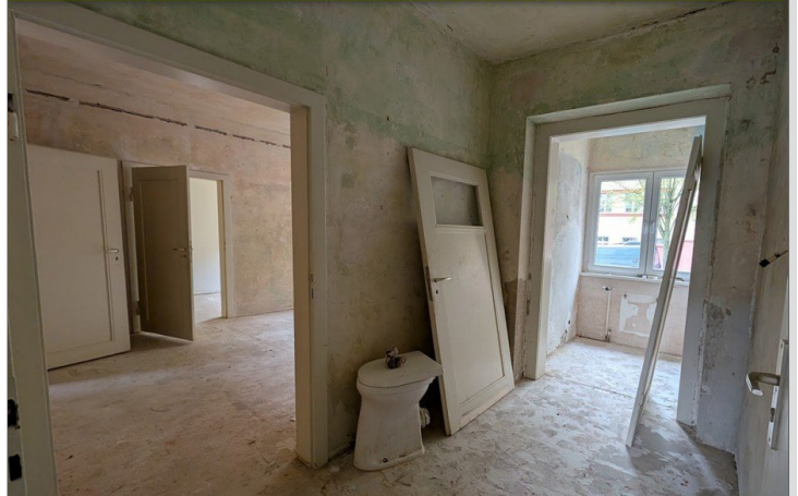
Wohnzimmer und Flur in Sanierung