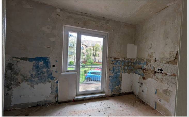
Küche - in Sanierung