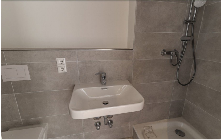
Beispiel Bad Referenzobjekt