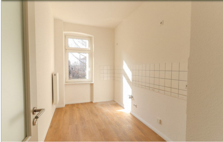
Beispiel Küche Referenzobjekt