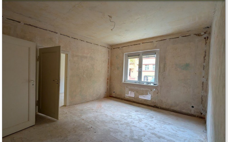
Wohnzimmer - in Sanierung