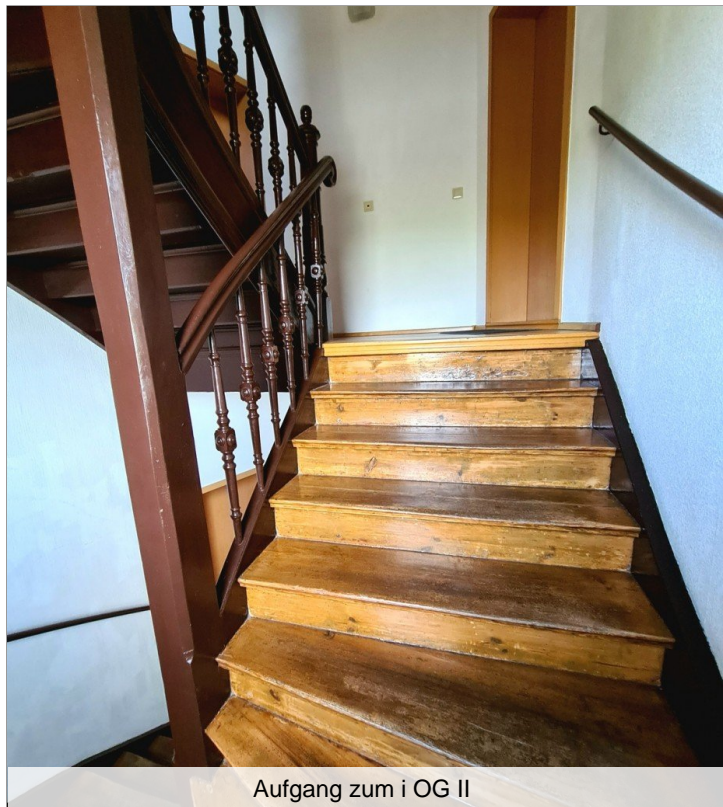
Aufgang zum i OG II