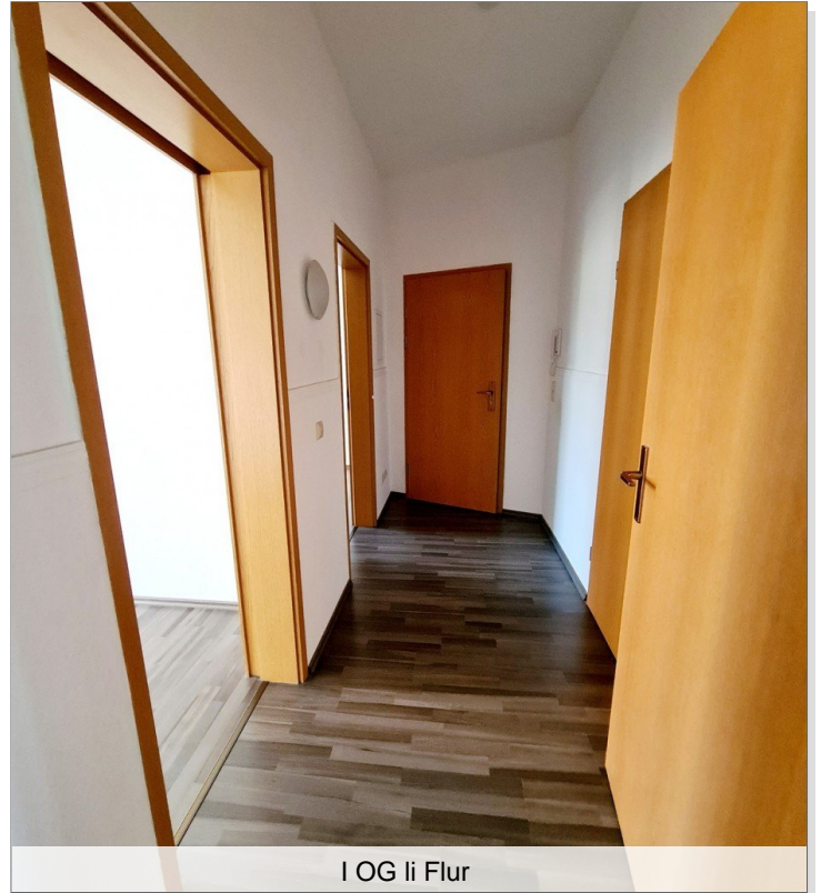
I OG li Flur