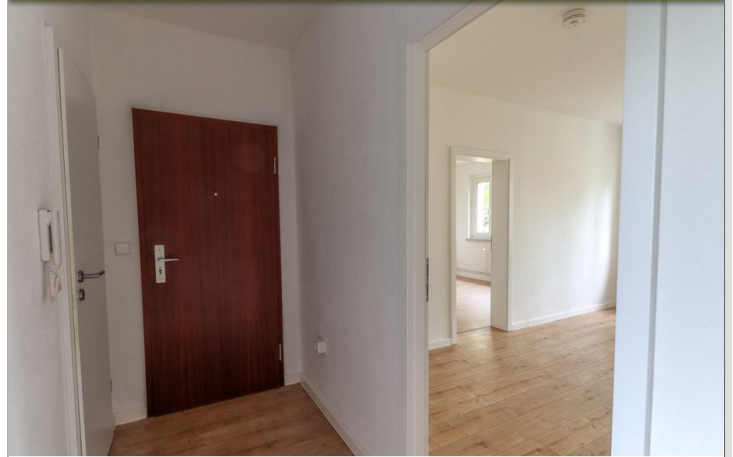
Flur mit Blick zum Wohnzimmer