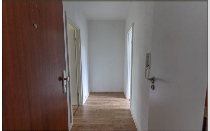
Eingang und Flur