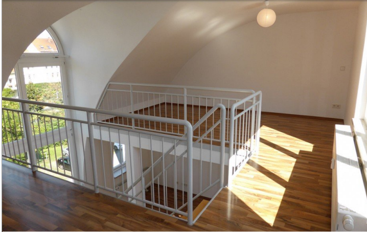
Galerie obere Ebene