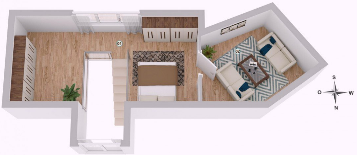
Grundriss obere Ebene