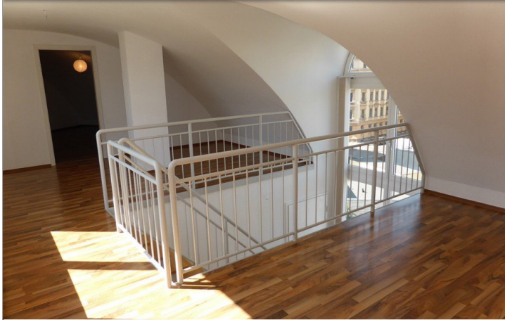
Galerie obere Ebene (2)