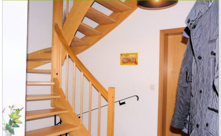
Treppe und Flur