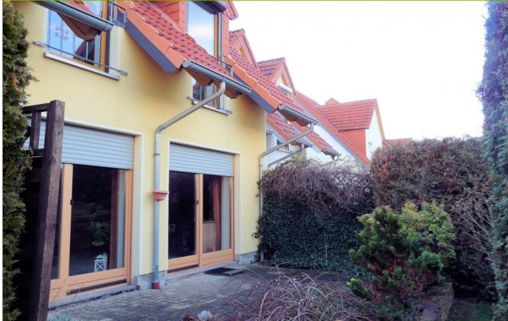
Hinteransicht Haus Otterwisch