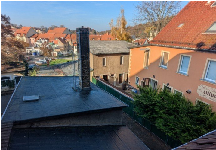
Grundstück mit Anbauten