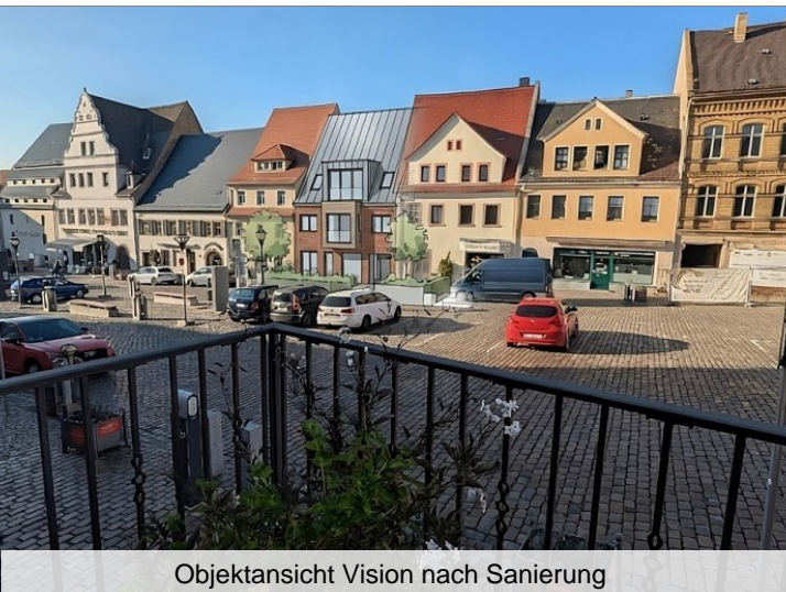
Objektansicht Vision nach Sanierung