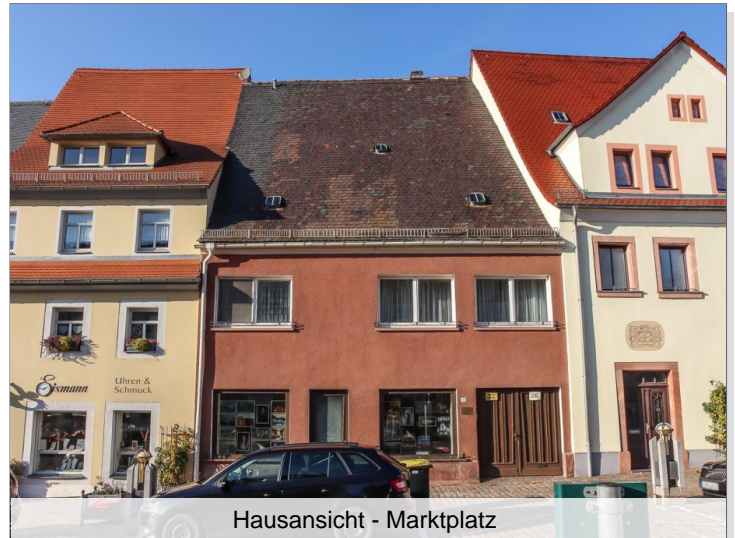
Hausansicht - Marktplatz